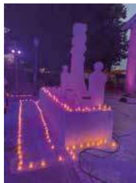
Concierto de Piedra y Agua (22 de julio de 2024). Ayuntamiento de Valdemoro