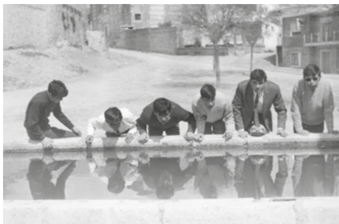
Amigos junto al antiguo abrevadero (1970).