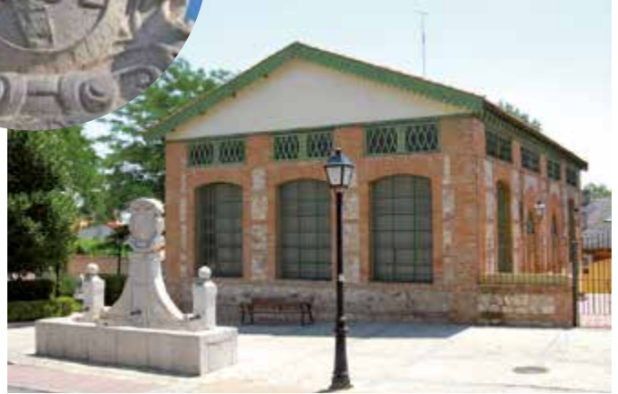
La Fuente de la Villa y el lavadero al fondo.

del Plan General de Ordenación Urbana de Valdemoro (2004).