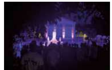
Conciertos con historia (17 de julio de 2025). Ayuntamiento de Valdemoro