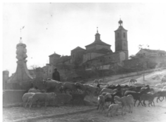
Rebaño de ovejas en torno a la fuente (1940).