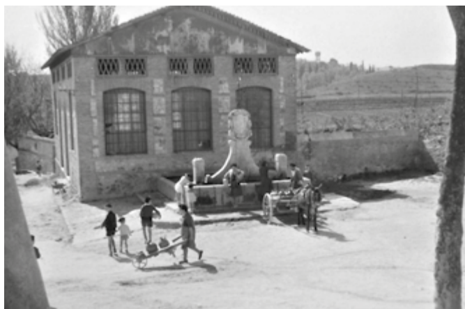
Grupo de personas recogiendo agua en la fuente. Años 50 del siglo XX.