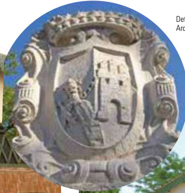
Detalle del escudo que corona la fuente.